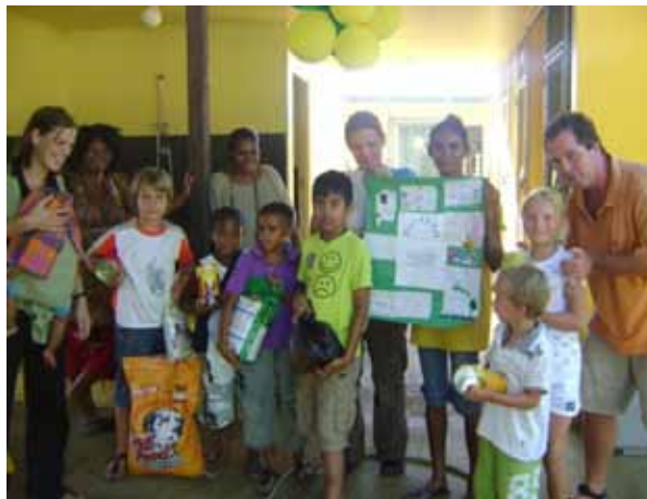
De Prinses Amaliaschool op bezoek

De feestelijke overhandiging kreeg een officieel tintje door de inleiding van juffrouw Karlyn. Alle brokken, blikken en koekjes werden onder luid geblaf dankbaar in ontvangst genomen. En na de nodige foto's werd het een vrolijke beestenboel. Alle honden en katten van het asiel bedanken de kinderen voor hun inzet.