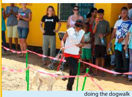
doing the dogwalk