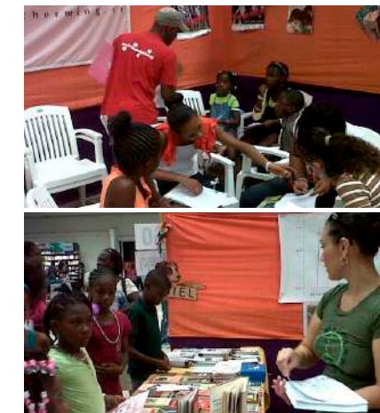
Kinderen worden educatief beziggehouden in de DBS stand tijdens het kinderboekenfestival

Met een nieuw educatief boekje 'Superbaasje', een doos vol dierenboeken, veel informatiemateriaal, een gezellig ingerichte tent en een enthousiast team van vrijwilligers, heeft de DBS ook dit jaar weer heel veel kinderen en scholen van veel informatie kunnen voorzien. Het doel van het KBF is om de jongeren van Suriname zoveel mogelijk te laten lezen en te leren dat je met lezen veel kennis kunt vergaren. Een belangrijke reden daarom voor de DBS om dit jaar met een eigen boekje voor de verzorging van huisdieren op het KBF te staan. Onderwijzers en kinderen reagerden heel positief op het nieuwe boekje. De organisatie kijkt terug op een geslaagde week. (Lees meer over 'Superbaasje' op blz. 4.)