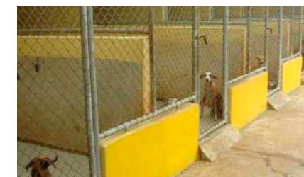
De hondenkokers op het asiel

De dieren kunnen na de operatie op het asiel herstellen, waarna ze helaas weer teruggezet moeten worden in de voor hun bekende omgeving, maar dan wel met een betere overlevingskans en in de hoop dat de buurtbewoners zich om hen (blijven) bekommeren. De buurtbewoners weten nu ook dat hun buurthondjes zich niet meer kunnen voortplanten. We hopen dat er nog vele sterilisaties zullen volgen!