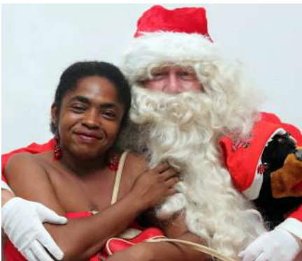
Op de foto met de kerstman

De Hal aan de Combé was voor 2 avonden weer omgetoverd in een cosy-Kerstmarkt. In deze periode zijn er veel andere evenementen, maar toch hebben velen een bezoekje gebracht en daarbij ook een hapje en drankje, een leuk boek of een van de andere vele mooie of grappige items gekocht. Het gratis gebruik van de Hal was een zeer welkome donatie waarvoor dank!